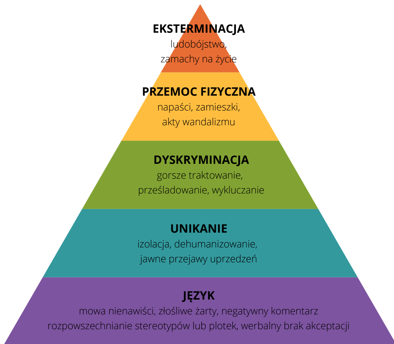
Rys. 1. Piramida nienawiści Gordona W. Allporta

Postawy (myśli, emocje, zachowania) jednostek składają się na funkcjonowanie społeczeństwa. Dyskryminacja nie jest efektem magicznej mocy, spontanicznej myśli czy zachowania pod wpływem emocji. Obozy koncentracyjne nie pojawiły się nagle, a były efektem wielu lat drobnych i stopniowych zmian społecznych. Dyskryminacja to jeden z etapów niebezpiecznego i społecznie wrogiego procesu nienawiści, który w formie piramidy zobrazował psycholog Gordon W. Allport (rys. 1).